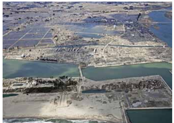
写真 3 東日本大震災後の閑上地区