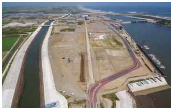
写真8 朝市と迂回路