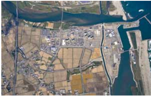
写真14 閑上地区完了時（2020年10月）