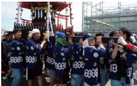
写真12 復興達成宣言「お浜降り」の神輿