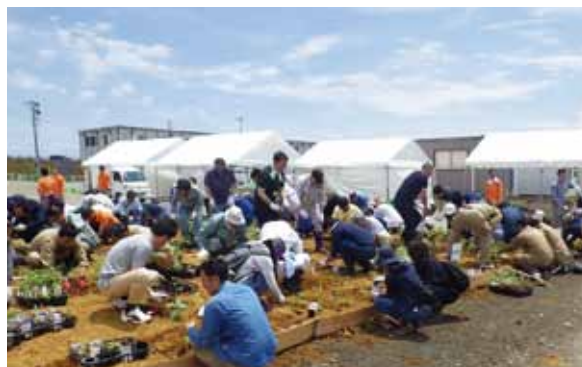
写真7 ひまわりの苗植付状況