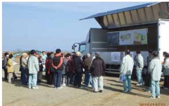
写真5 現場説明会状況

今回の事業では、早い段階から現地説明会を実施した。これは地域住民からの「津波に耐えうる街とは、どのように作っているのか、どんな風に出来上がるのかを教えて欲しい」という強い要望があり、工事の進捗に応じて丁寧な説明会を何度も開催した。特に、約5.0mの嵩上げとはどんなものなのか、そこからどんな風景が見えるのかを体感したいという事もあり、一部嵩上げが終了した宅盤を早期に準備し、住民の方々を招き定期的に見学会を実施し理解を得ることができた。