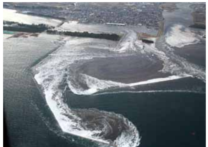
写真 1 東日本大震災時の閑上地区

津波発生当日より、自衛隊と共に行方不明者捜索とガレキ集積を行い、名取市閑上地区では当社を含めた名取市の地元建設業者 24 社が災害援助チームを発足し、名取市発注の委託業務を開始した。