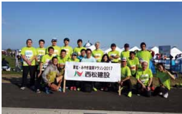
写真10 スタート地点にて記念撮影