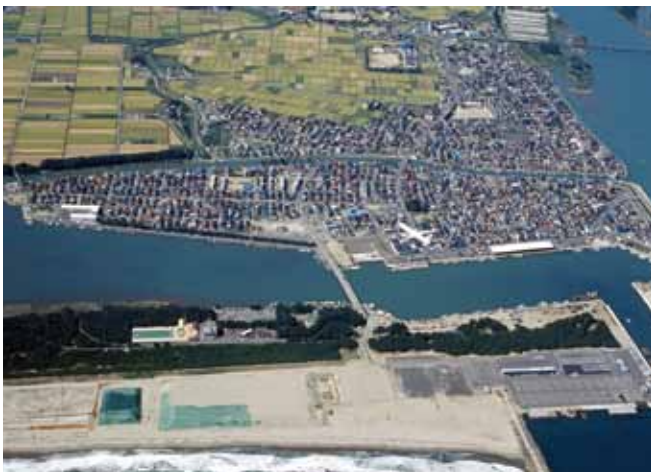
写真 2 東日本大震災前の閑上地区