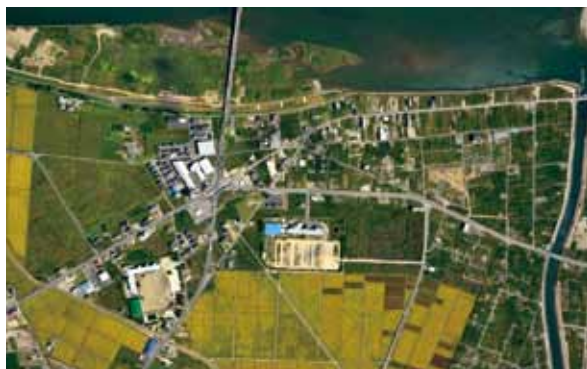
写真13 閑上地区着工時（2014年9月）