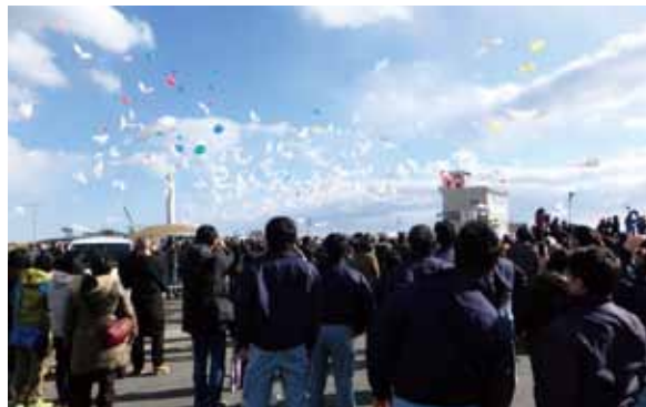
写真6 JV職員による鳩型エコロジー風船飛ばし

2017年10月には被災地の復興喚起の一環として、復興マラソンが行われた。この大会は国際規格に則ったも