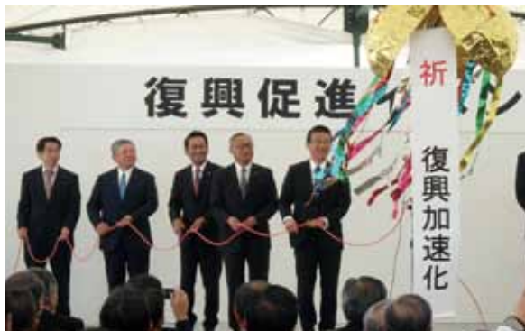
写真11 復興促進イベント