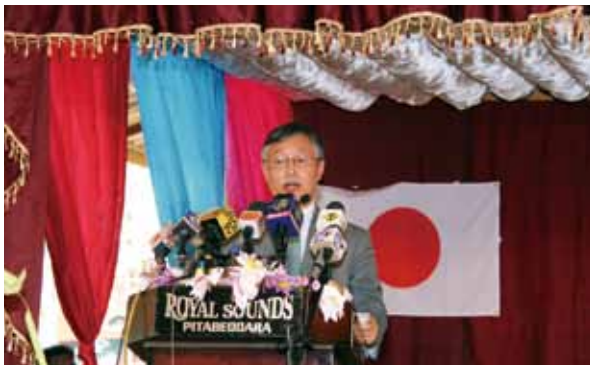
写真16 日本国大使のこたば