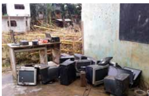
写真11 水没したコンピューター