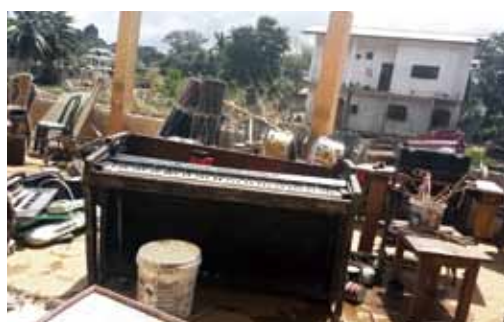
写真10 土石流を被ったピアノや楽器