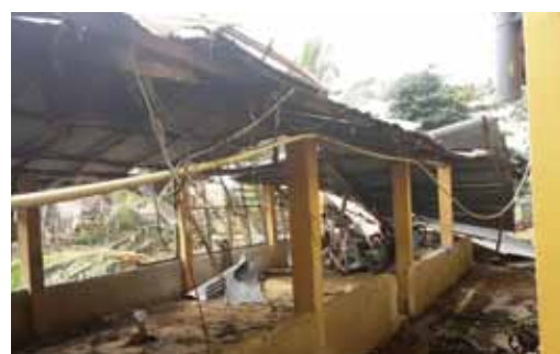
写真9 破損した一階部分