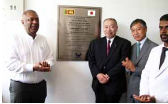
写真15 日本国大使、財務省大臣、弊社五百歳社長による防災の誓い版除幕