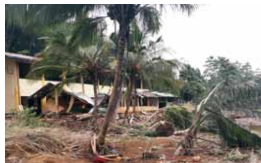
写真8 校庭の土石流木材被害