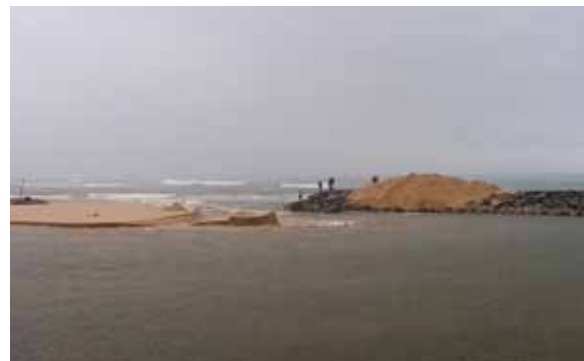
写真6 堆積砂撤去後