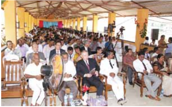
写真14 生徒父兄の式参列