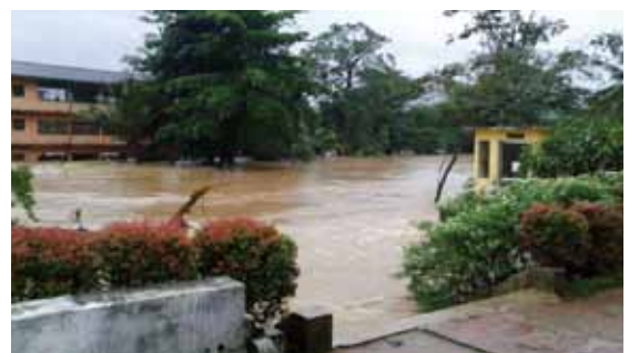
写真7 冠水した校舎