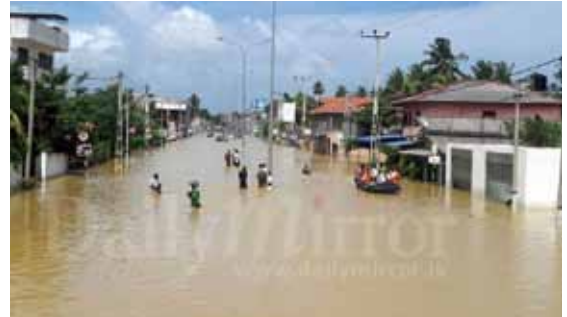
写真3 冠水した主要道路

雇用スタッフ 150 名の内、16 名のスタッフ及び家族が被災に遭遇していることを踏まえ、これを最優先してすべきこととした。日本人を含め、ナショナルスタッフから集めた寄付金は食料品に代えて 16 家族に届けられた。床上まで泥水に浸かった家屋、破損が生じた家屋に、弊社保有の資材・機材・労務を総動員しての清掃・補修にあたった。(写真 3)