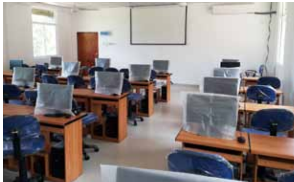
写真17 改装された新コンピューター室

さて、偶然にも被災地の近くで工事の為の拠点と資材・機材・労務を抱えていた弊社の防災あるいは復興に関する考えを述べさせていただく。