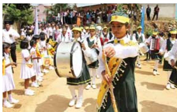
写真13 同校ブラスバンド部による元気な先導