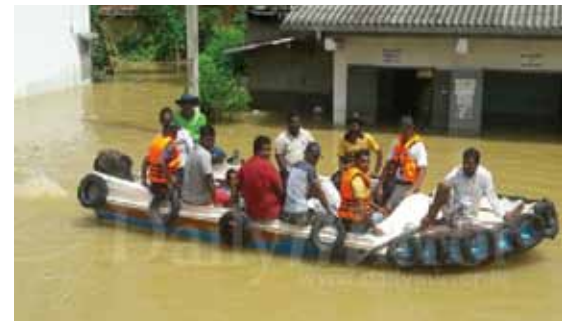
写真4 ボートでの被災民、物資の運搬

各地域の警察署や役場からの、機材提供要請依頼があった。約 1 週間続いた洪水で、道路は寸断され冠水状態となっていたため先ずはボート、そしてボートを運ぶ為の運搬車を提供した。(写真 4)