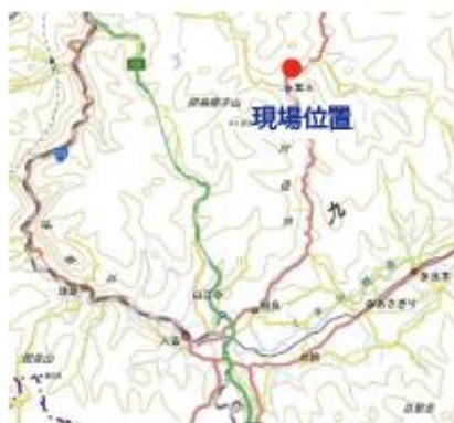
図4 国道445号（九折瀬工区）道路改良工事位置図