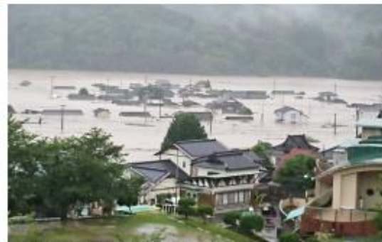
写真6 水没する集落