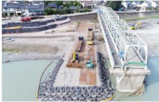
写真9 仮設ヤードの築造