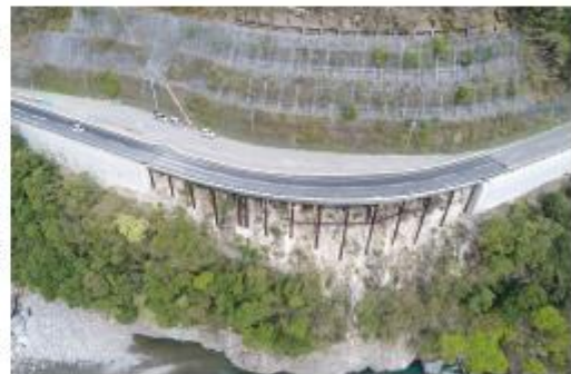
写真13 写真2現場の完成写真 (2021年3月)