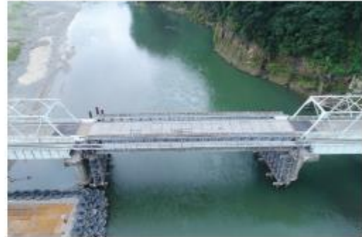
写真12 西瀬橋の仮開通