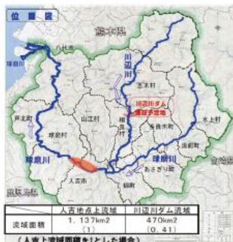
図2 川辺川ダム建設予定地1)と今回の被害範囲 ●は網掛け部分

なお、当工事は氾濫区域から30km程度離れた山間部での施工だったため、水害被害は免れ、数日の工事休止のみでほぼ順調に工事を進めることが出来た。