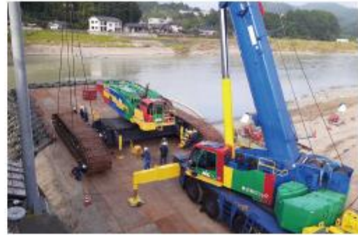
写真10 500t クレーンの組立