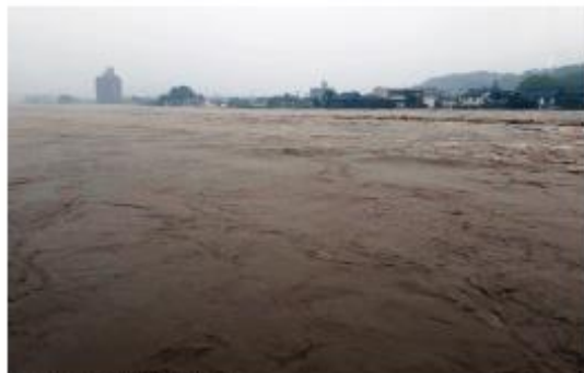
写真5 氾濫する球磨川

弊社の請負工事の元請会社である丸昭建設様は地元の「熊本県建設業協会人吉支部」の支部長会社でもあり、球磨地域振興局との協議による球磨川支川の万江川堤防の 120m にわたる決壊箇所の復旧工事や、国土交通省の権限代行による一部の橋桁が流出した西瀬橋の仮橋設置工事を担当された。以下にはご提供いただいた情報により災害復旧の状況写真を掲載する。