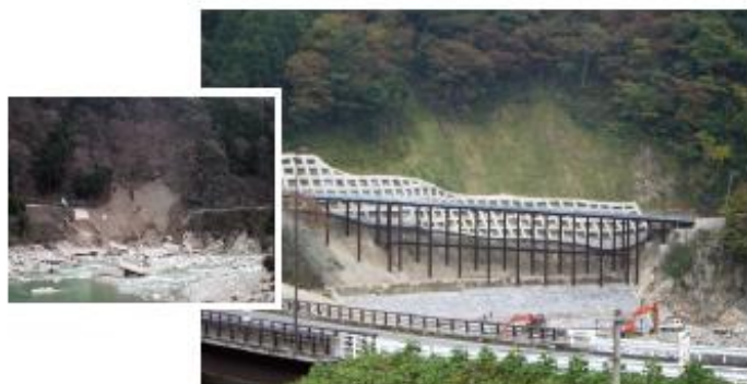
写真1 岐阜県 災害復旧工事の例（災害直後、復旧完了）