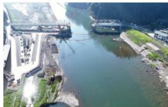
写真8 西瀬橋の復旧工事