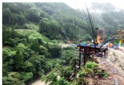
写真2 施工状況（川辺川は増水）