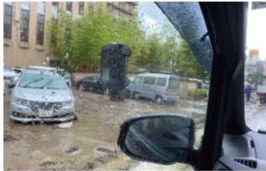
写真3 倒立する自動車

下の写真は豪雨に襲われた数日後に弊社の担当者が撮影した人吉市内の被害状況である。いずれも浸水深 5~10m にも及んだと推定されている洪水の苛烈さを物語る写真であり、被災された住民の皆様のご心痛を考えると発する言葉がない。