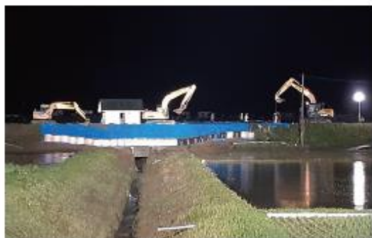
写真7 堤防の応急復旧工事